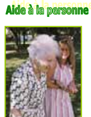
Aide à la personne