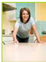
Ménage - Repassage