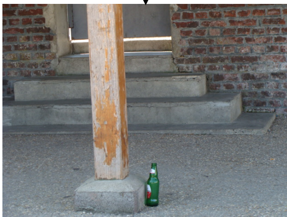
Préau de l'école primaire

Est-ce si difficile de respecter notre environnement ?