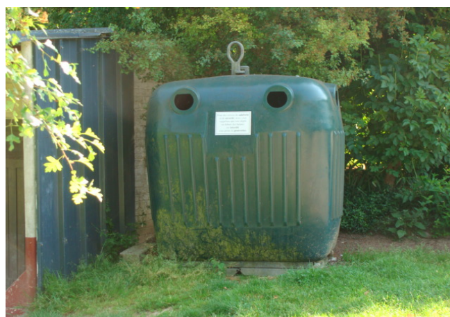
Container au terrain de foot