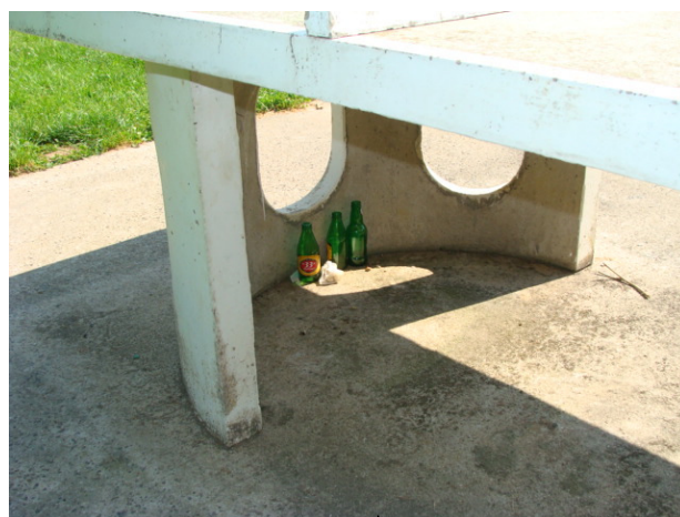
Table de ping-pong au terrain de foot