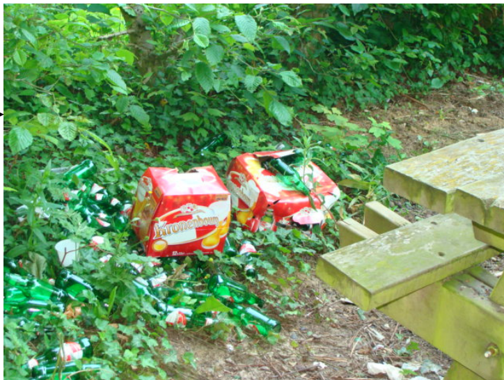
Les abords de l'Omignon

Ces lieux de ralliement sont facilement identifiables par l'amoncellement de canettes de bière laissé à même le sol. C'est d'autant plus regrettable que les containers sont à proximité!